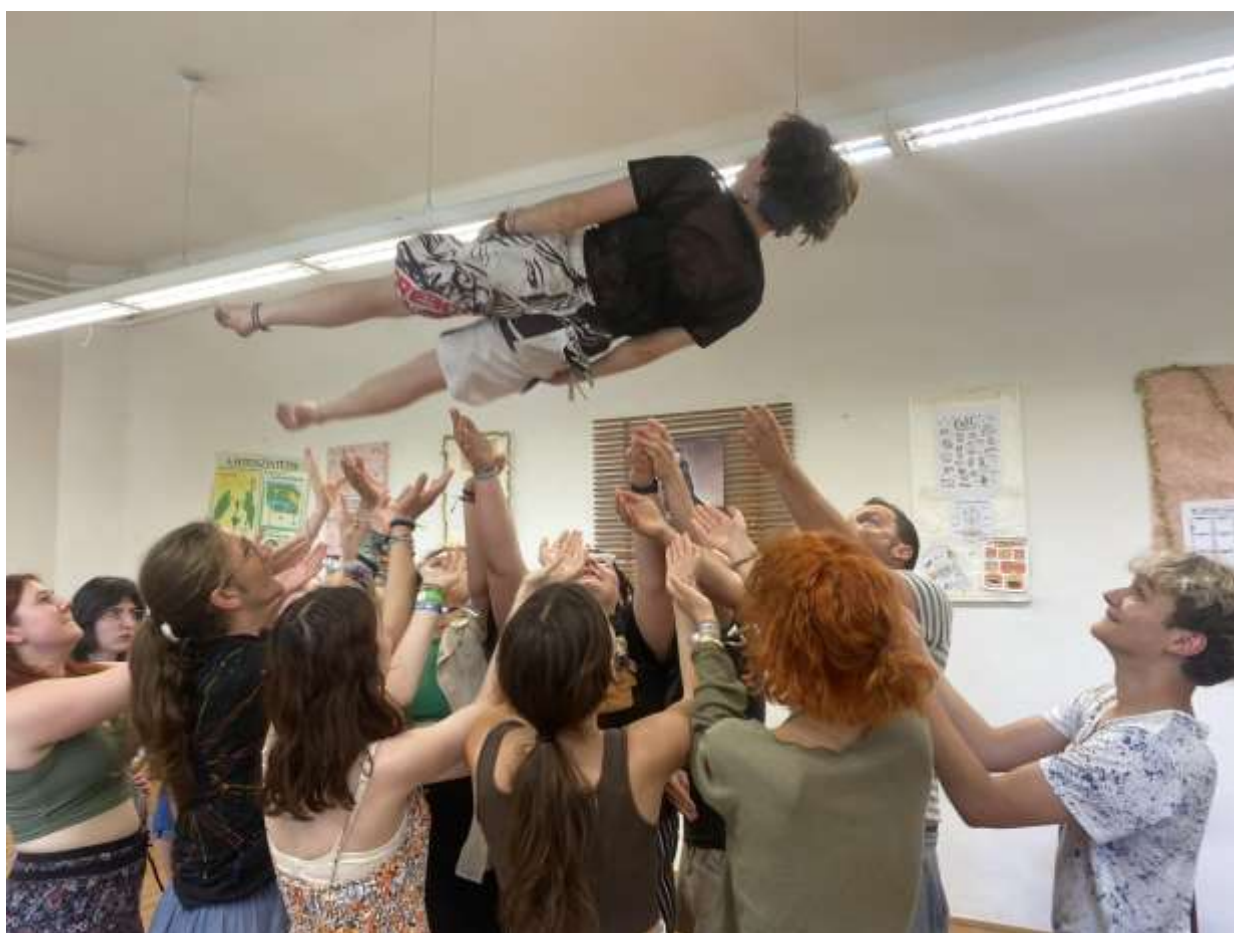
1. ábra bizalom és szabadság