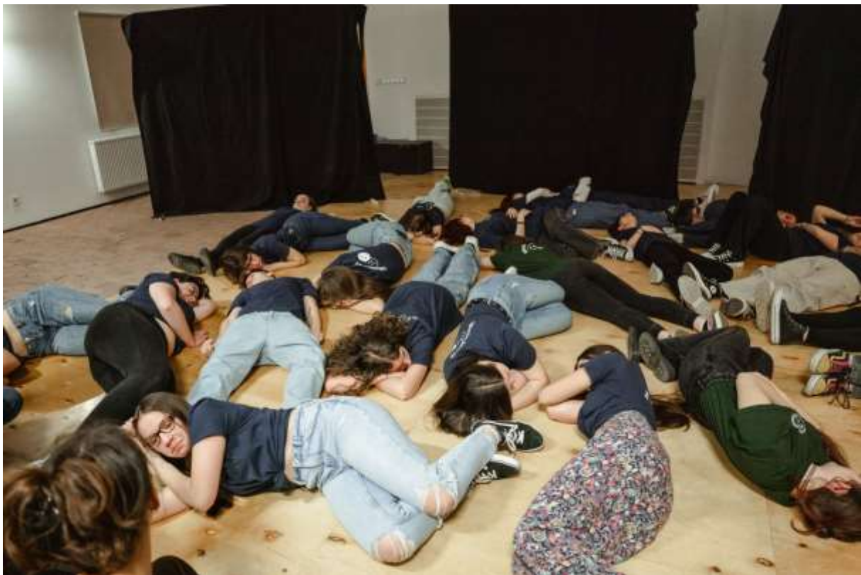
4. ábra RDT, bemutató

Azt gondolom, hogy a rendezvény szakmailag egy fejlődési lehetőséget biztosított a diákoknak, hiszen a zsűri meglátásait fel fogják tudni használni későbbi színházi jellegű munkáik során, valamint magas szakmai színvonalú előadásokat tekinthettek meg.